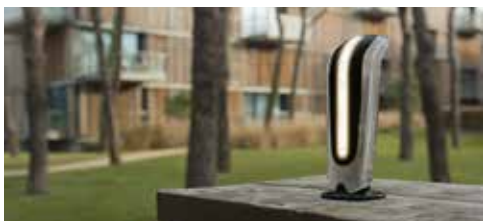
Instalación vertical columna