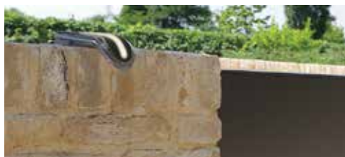
Instalación horizontal columna